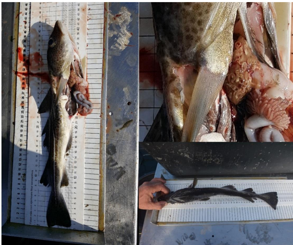
Figur X. En mager östersjötorsk som är kraftigt infekterad med levermasken ( Contracaecum osculatum ).